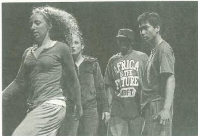
La compagnie Engrenage fera une répétition en public, ce jeudi avant la première qui aura lieu samedi 9.

Jeu 7 à 19 h, la compagnie ouvre les portes pour une répétition publique. C'est l'occasion d'assister à