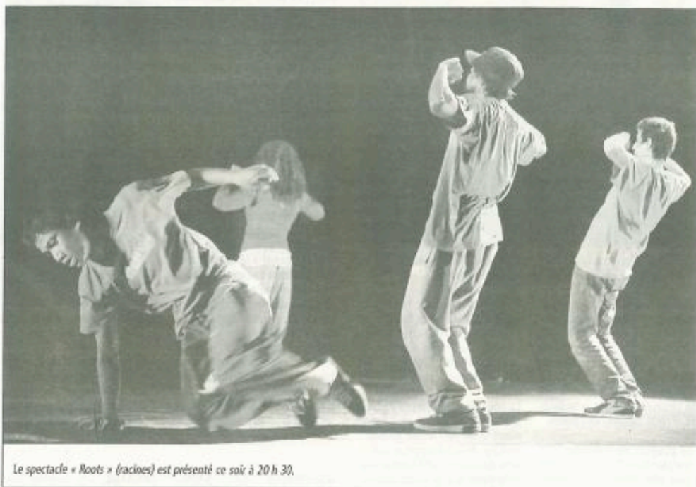
Le spectacle « Roots » (racines) est présenté ce soir à 20 h 30.

Le centre Athéna présente aujourd'hui « Roots ». Une exploration du corps et du mouvement qui revient aux racines de la danse.